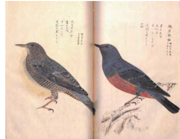
『両羽博物図譜』は、植物、昆虫、蜘蛛、魚類、両生類、鳥類、きのこなど多種にわたる博物を実証的に調査し、美しい毛筆で写生した貴重な図録である。

これからの百年、 もつともつと輝くように。 庄内に生きる人を、 とことん見守っていききたい。 庄内を愛する人を、 とことん支えていききたい。 とことん、庄内。 つるしん、新たな百年への決意です。