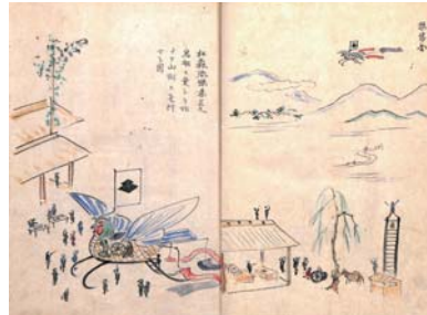
自ら発明した飛行機「鳥船」の完成予定図。月山から山形までの飛行計画を立てていた。

文政8年(1825)、鶴岡の中級士族・長坂家の9代目として生まれる。13歳で庄内藩校致道館に入所。32歳で助教(教頭)に就任。38歳で家督を継ぎ致道館を去るまで藩士の子弟教育に励む。39歳で庄内藩の支藩・松山藩の家老に就任。戊辰戦争でも大きな戦果を挙げるなど奮闘。長年の功績により藩主から「松山を守ってくれた」との感謝の意を込めて「松守」の姓を賜るも、おそれ多しとして「松森」と改称し以後、名乗るようになった。59歳で『両羽博物図鑑』の執筆を始める。明治25年(1892)、永眠。享年68歳。